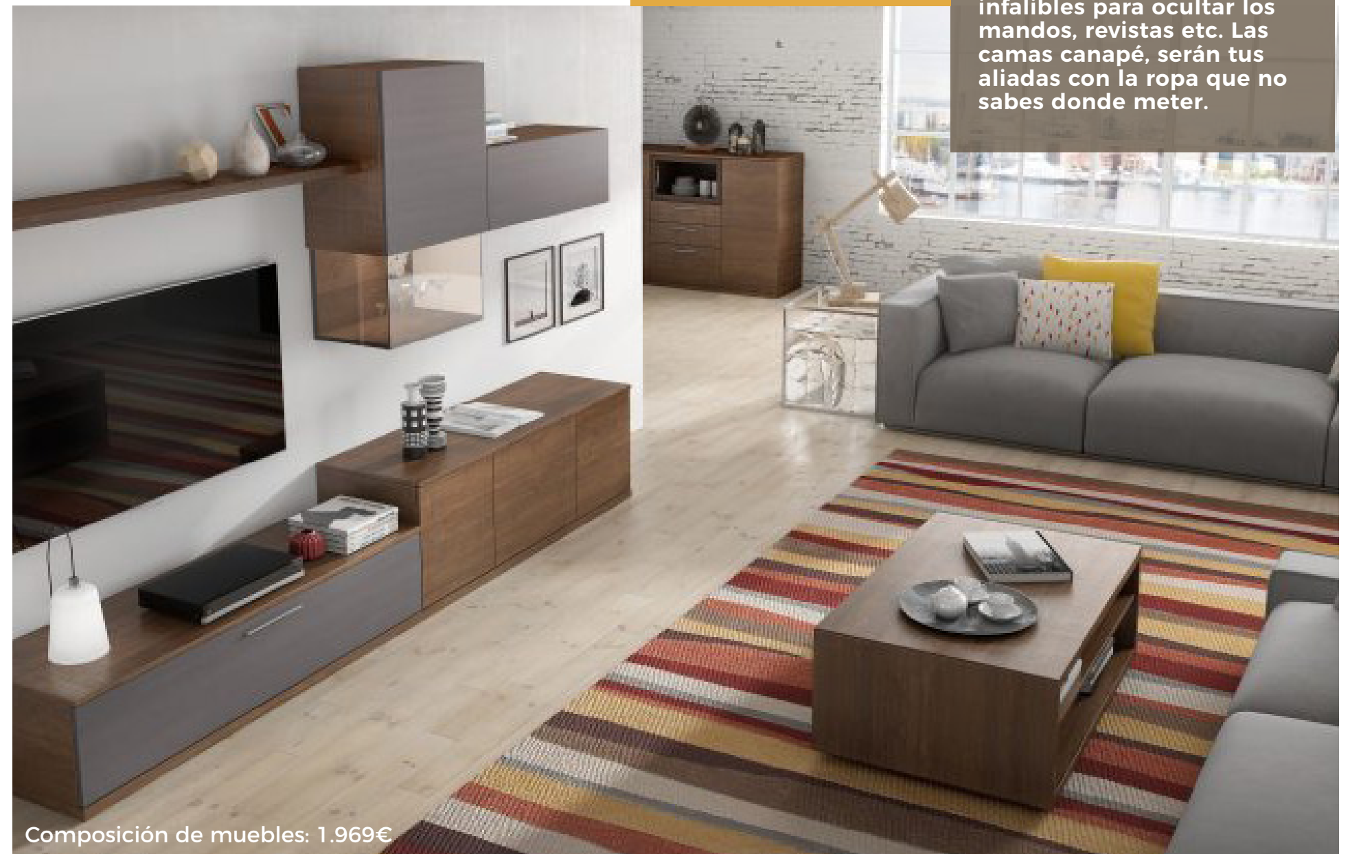
Composición de muebles: 1.969€

Cuando entras a una casa y está ordenada, la felicidad corre por tu interior, aunque no lo notes. Pero si eres una persona desordenada por naturaleza, hay muebles que te pueden ayudar. Por ejemplo, las mesas de centro con tapa son infalibles para ocultar los mandos, revistas etc. Las camas canapé, serán tus aliadas con la ropa que no sabes donde meter.