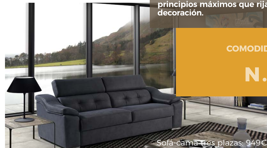
Sofá-cama tres plazas: 949€

Quizás te hayas enamorado de un sillón o una mesa, ¿pero va a contribuir a generar ese espacio de paz? Antes de lanzarte a la compra y dejarte llevar por las emociones, piensa que el confort y el bienestar tienen que ser los principios máximos que rijan la decoración.