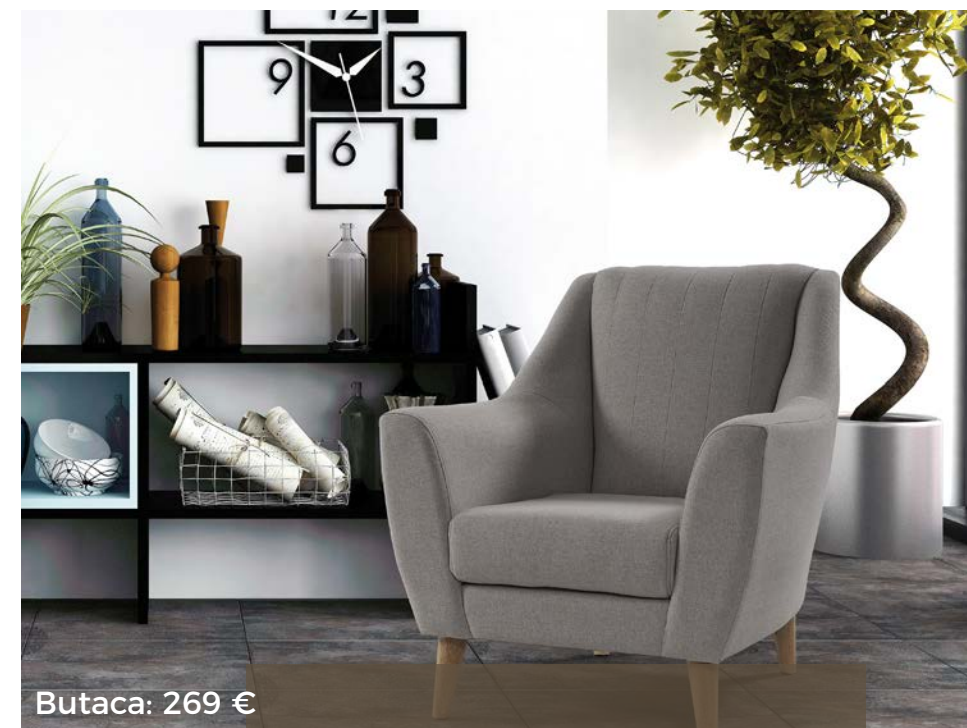
Butaca: 269 €

Según la regla de 60/30/10, los colores neutros tienen que abarcar el 60% del espacio. Su amplia capacidad de combinación con otros matices generan un ambiente cálido y acogedor.